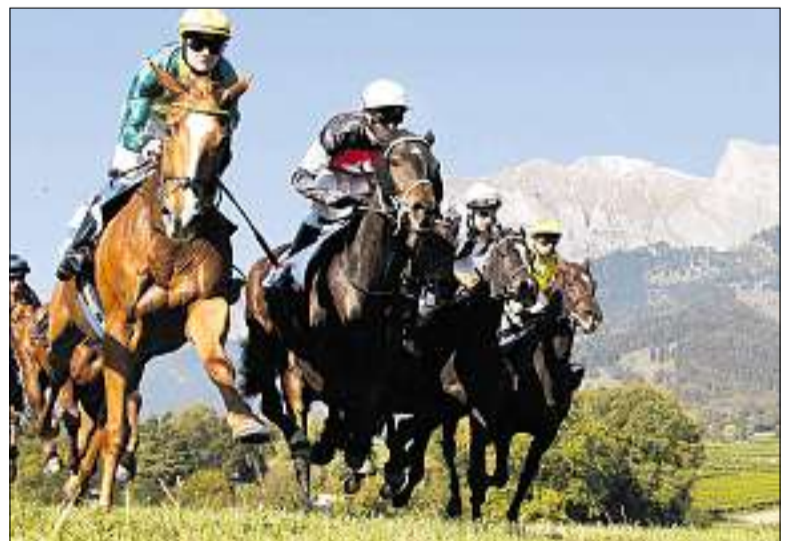
Ross und Reiter legen sich ins Zeug: spannender Kampf um den Grossen Preis der Stadt Maienfeld.